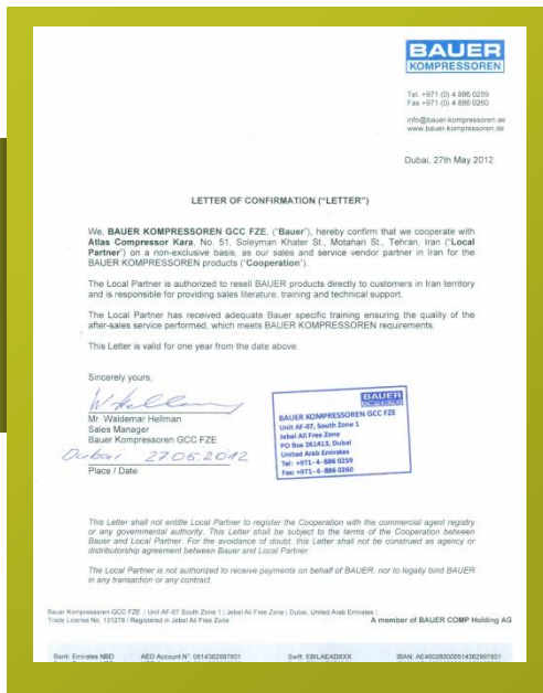
Bauer agency certificate