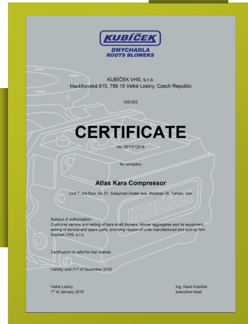
Kubicek agency certificate